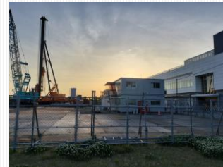
艇庫棟裏に建設中の第二艇庫(仮称)