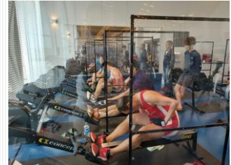
ハードな陸上トレーニング