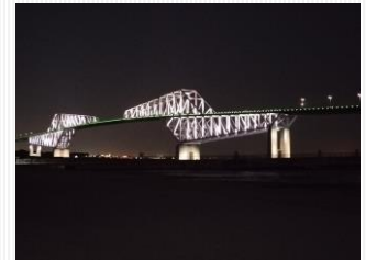
21時前のゲートブリッジ 選手は就寝中

ここ海の森では、5月18-21日に全日本ローイング選手権が開催されますが、今回パラ種目が正式実施種目となり、20・21日にはPR1W1x・PR3Mix4+クルーがタイムトライアルレースに参加します。是非ご来場いただき、ご観戦ください。パートナー様にはチケットにつき ご案内いたします。