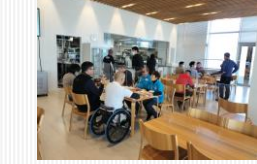
食堂とケータリングサービス