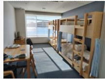
宿泊室 バストイレもバリアフリー仕様