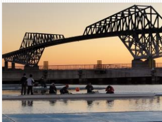
明け方より練習開始

パラローイング日本チームは、1月27-29日東京ゲートブリッジを望む 海の森水上競技場にて強化合宿を行いました。シングルスカル・ペア・舵手つきフォアで乗艇し有酸素トレーニングや技術練習を行いました。同競技場は東京パラリンピック大会の会場であり、トレーニング施設・宿泊施設も充実し、エルゴメーター・ウェイト・ワットバイク等陸上トレーニングも手軽に行えます。宿泊設備もバリアフリー対応となっておりパラ選手も不自由なく宿泊できる施設です。また、東京メディカル・スポーツ専門学校の方々にもサポートいただき、体のケアにも努めることができ、実り多い合宿となりました。