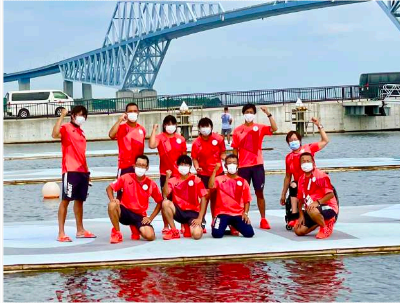
↑実力を出し切り次の挑戦へと進むパラローイング日本代表選手団！

真夏・快晴の東京でついに迎えた大舞台：東京2020パラリンピック！たくさんの温かい応援をありがとうございました！