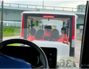
↑選手村へ専用バスで入村