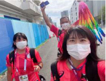
↑激励の千羽鶴を持ち居室へ