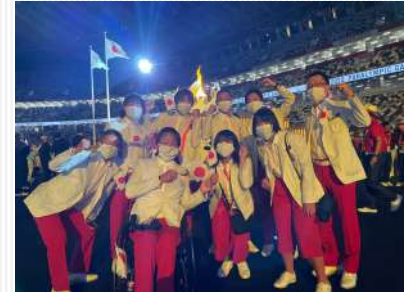
↑開会式・聖火の前で記念撮影