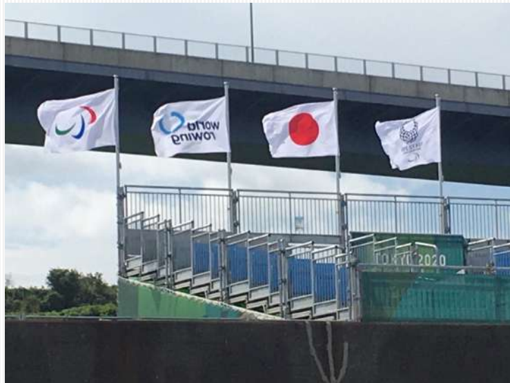
↑左からパラリンピックのシンボル「スリーアギトス」、worldrowing、日本国旗、東京2020パラのマークが旗めく。