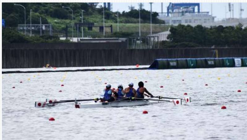
↑PR3 混合舵手つきフォア。 ↓全力を出し切ったレース後!