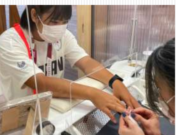
↑村内にはネイルサービスも