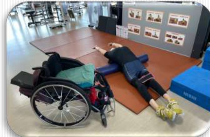
↑↓ウェイト施設でトレーニングに励む選手たち