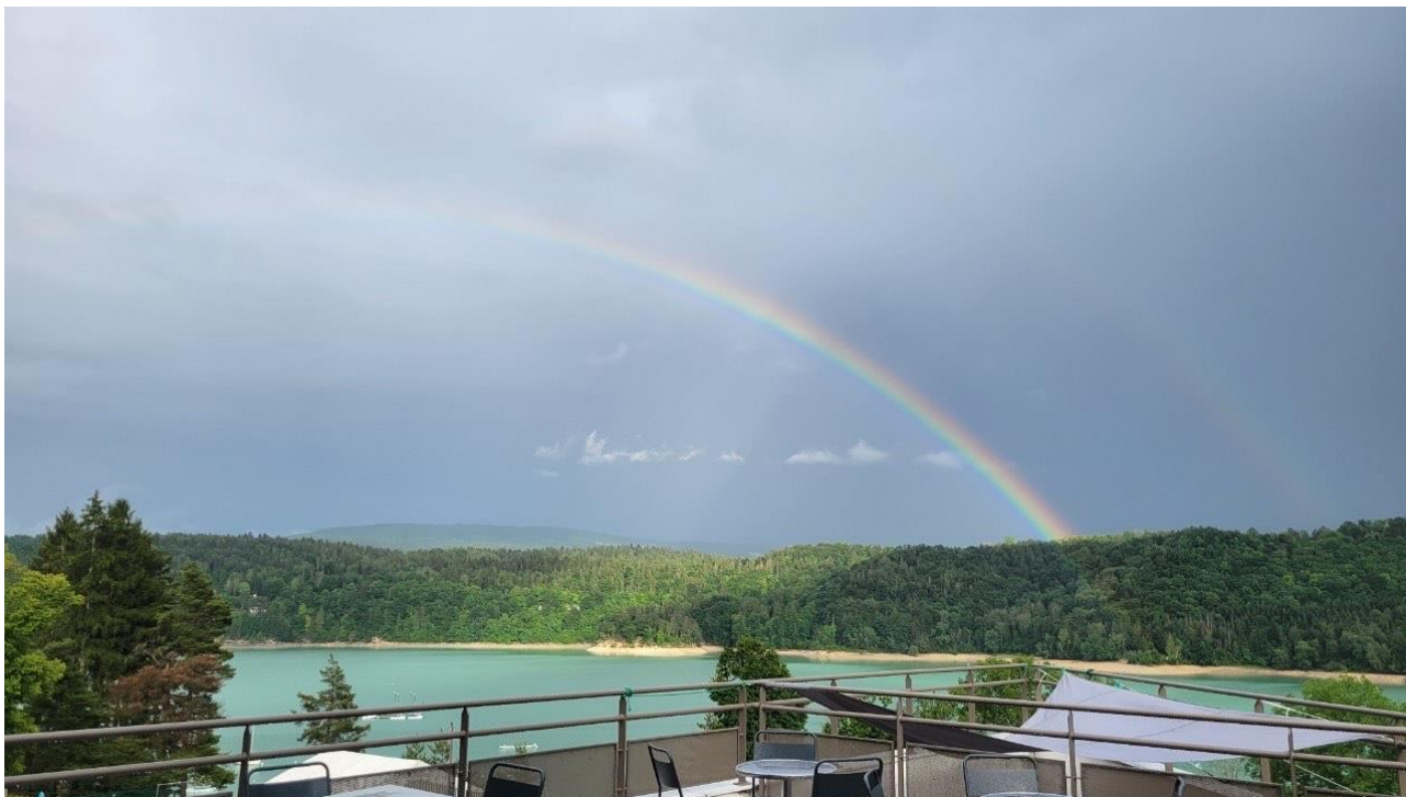
虹の写真

最近の天気は雨が降ることが多いが、日本の梅雨とは若干異なる。数十分雨が降っては、晴れ間が出ての繰り返しの中、時々大きなストームがやってくる。そのような中、本日綺麗な虹が見られた。虹はフランス語で「L'Arc-en-Ciel」といい、日本人なら一度は聞いたことがある言葉（アーティスト名）だろう。「空に（en-Ciel）アーチ（L'Arc）」という意味である。