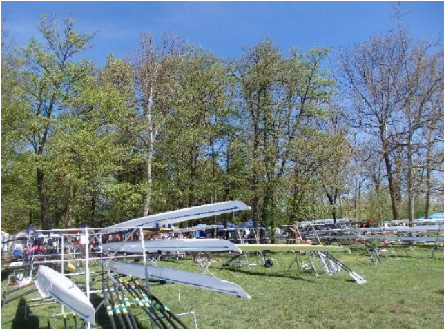
艇置場にもぎわってきました。