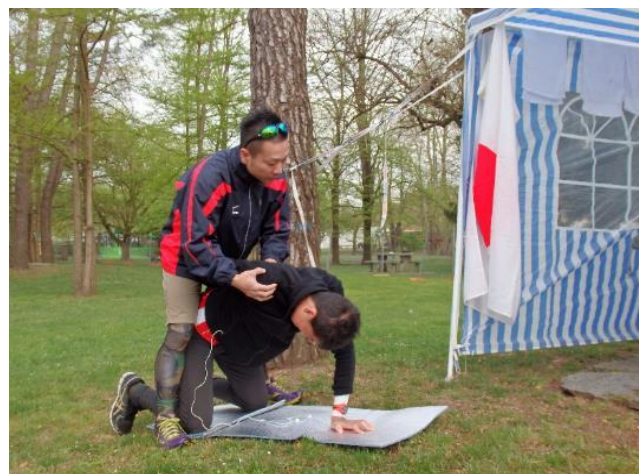
部谷トレーナーも選手と共に戦っています。