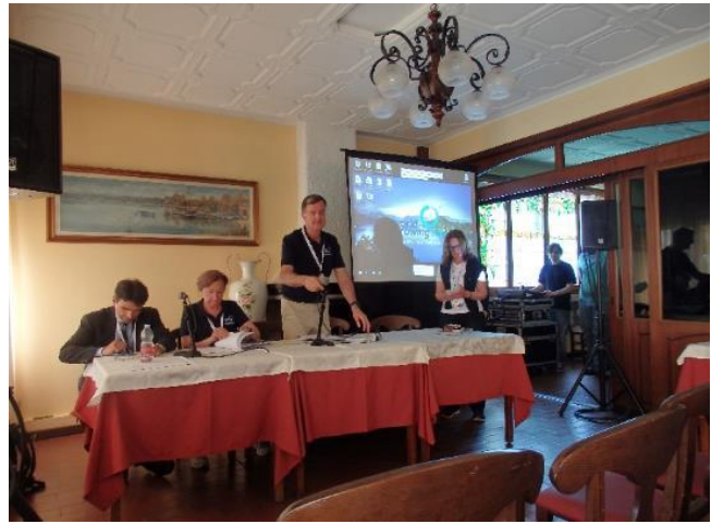
16:00からチームマネージャーミーティングが行われました。