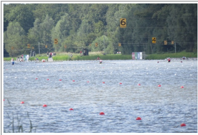
写真 2. スペアレースの様子

いました。スペアレースとは世界選手権に出られない代表選手が出場するレースです。各国の代表クルーを支えてきた選手によるレースです。