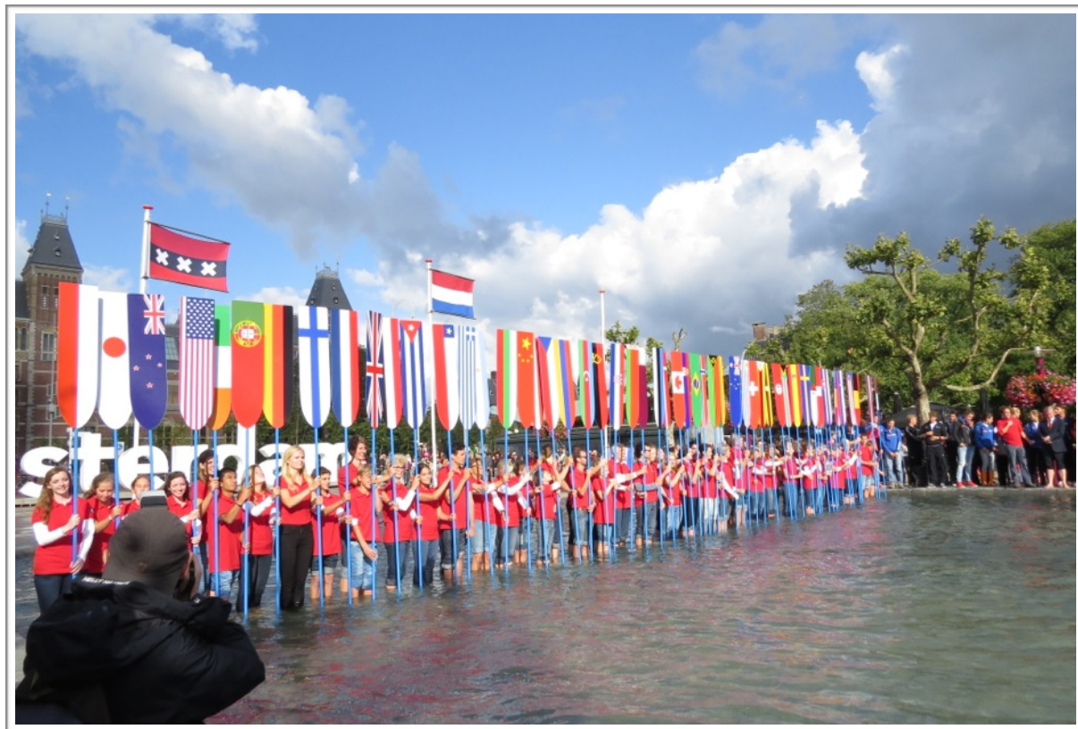
写真 1. Opening Ceremonyの様子