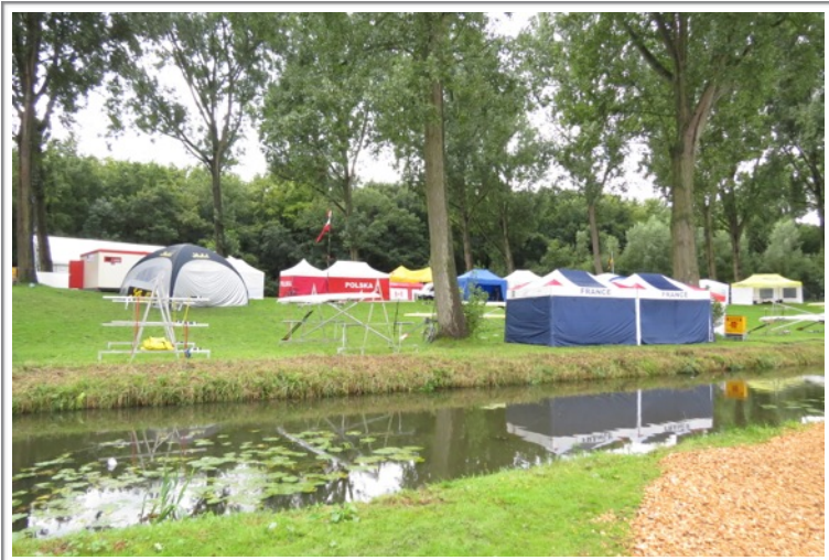
写真 8. コース脇に設置された各国のテント