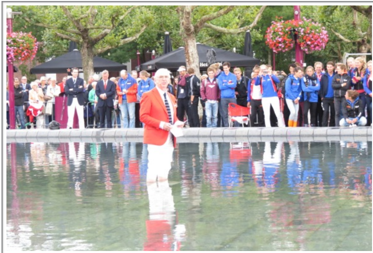
写真 13. 水の中からの挨拶