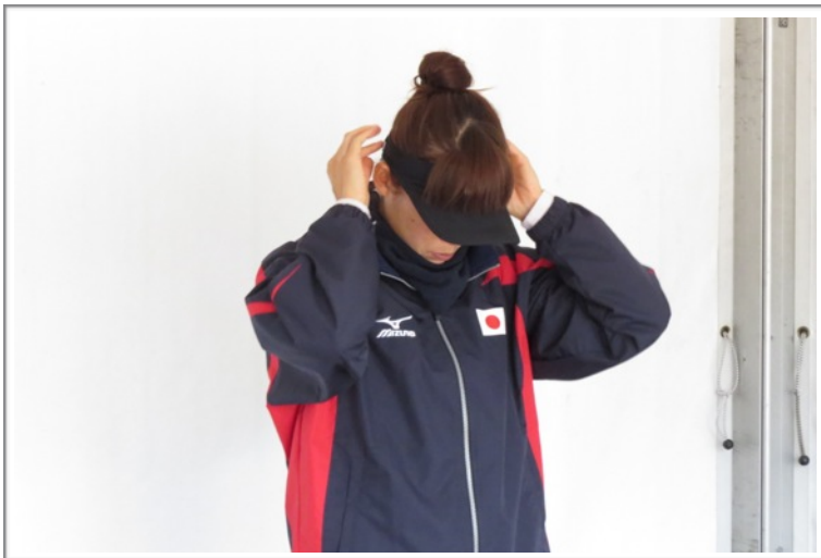
写真 4. 末廣選手（デンソー）