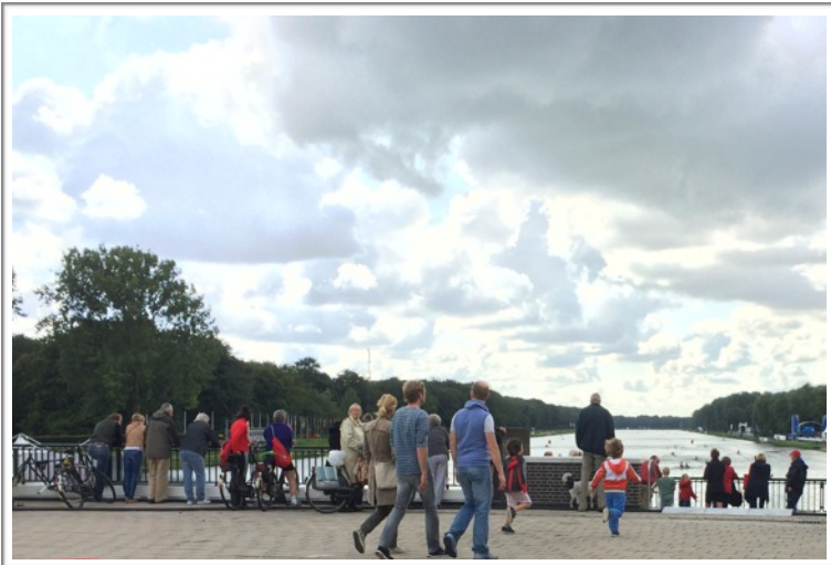
写真 7. ボートコースに集う一般の方々