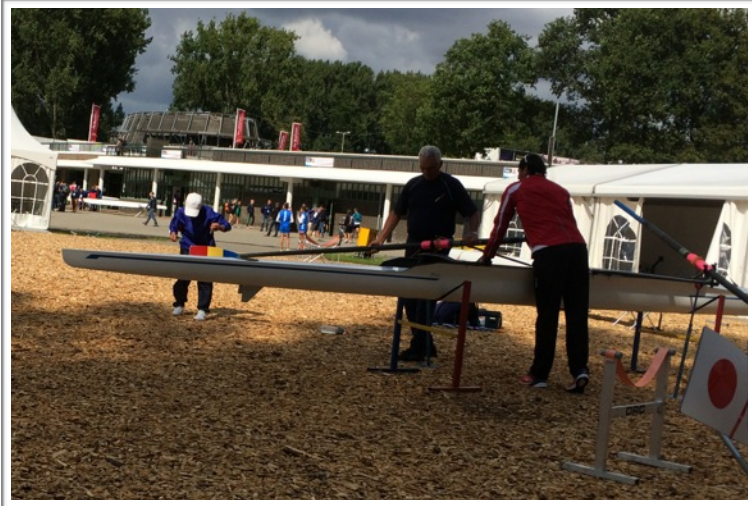
写真 6. 他国のリギングの様子。ブレードから錘を垂らし、角度を測定しています。