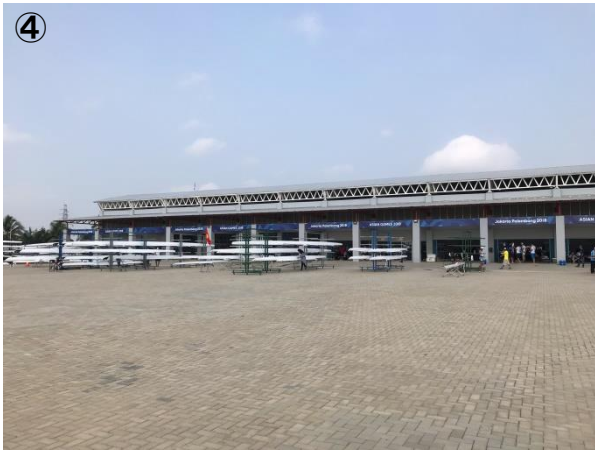
写真④: 巨大なボートハウスと広大なボートストレージエリア。

ボートハウスは巨大で、中にロウイングタンクまで作られていた(写真④)。ボートハウスの前のボートストレージエリアも広大で、本大会の参加クルーがすべて艇を置いても、余裕の広さだった。しかし、早くもあちこちで地面が陥没していて、将来が思いやられた。グランドスタンドも巨大で、階下に多数のミーティングルームがあった。その数は、大会に必要な部屋の数以上だったので、部屋から部屋への移動に時間がかかり、効率は悪かった。エアコンはよく効いており、建物の中は快適だった。