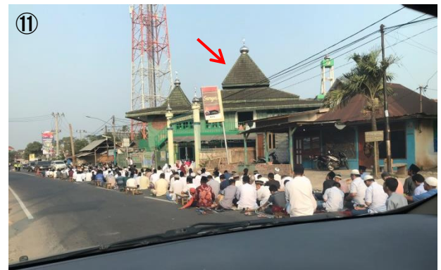
写真⑪: モスク(矢印)に入りきれず、道路にあふれたイスラム教信者たち。

しかし、毎週 2 回、ある曜日(教えてもらったが忘れた)の朝の決まった時間に、イスラム教の礼拝がある。その地域のほぼ全員が近くのモスクに集まって、地面に頭をこすりつけて何度もお祈りをする。だが、人が多すぎてモスクの中にはとても入り切れない。あふれた人たちは周囲の道路に座り込み、道路をふさいでしまう(写真⑪)。この時間帯にぶつかると、車はどうしようもなくなる。バスは迂回に迂回を重ねて、ふだんの何倍も時間をかけてようやくコースにたどり着いた。