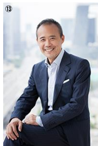
写真⑬:会長選に出馬しなかった 王石ARF前会長(2015~2018)。

王氏はChina Vankeという中国最大の不動産開発会社の創業者で、ARF会長就任以来、毎年大金をARFに寄付してきた。王会長就任前の2014年度のARFの年間支出は37,500米ドルだったのが、2018年度は869,772米ドルと、20倍以上に増えている。王会長の財政支援を得て、この4年間でARFはめざましい発展を遂げた。新加盟国のカンボジア、バーレーン、ネパールの3か国はいずれもARFから資金援助を受けて、Rowingに必要なボートや関連設備を整備した。ARFの主催大会としてアジアマスターズレガッタとアジアコースタル選手権が新設された。コーチ、ジュニア、パラ、トップアスリート等を対象にしたDevelopment Campが毎年アジアのどこかで開催された。2014年のARF Statutesの改訂によって、会長の再選