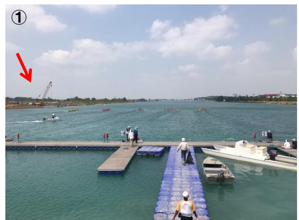
写真①:レースの横で護岸工事が進行中(矢印)

第18回アジア競技大会のRowingは、2018年8月19～24日に、スマトラ島南部にあるパレンバン Palembang 市近郊の Jakabaring コースで行われた。この地域一帯に、アジア大会のために新しく作られたスポーツ施設が点在している。この人工コースで昨年、アジアカップが開催されたが、コースの掘削が完了しておらず、本来のスタート予定地より約150mフィニッシュ寄りからスタートしたようだ。今回も、2,000m、6レーンは確保できたが、コースを取り囲む岸の大部分の護岸工事はほとんどできておらず（写真①）、スタートタワー（写真②）、アライナーズハット、フィニッシュタワー（写真③）の周辺一帯は茶色の地肌が露出していた。