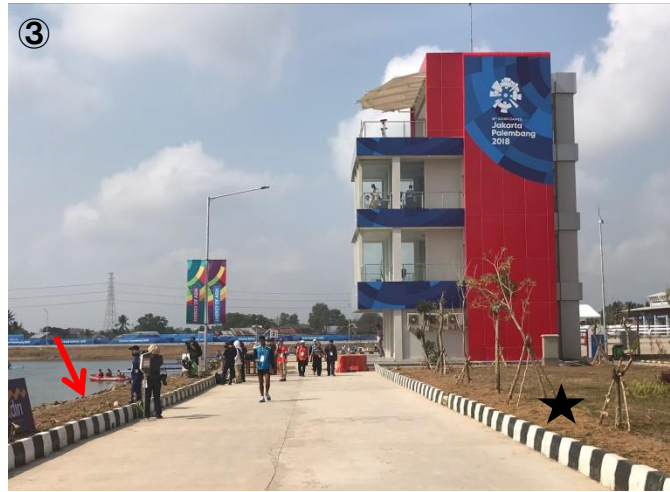
写真②: スタートタワー周辺はまったく舗装されていない。 写真③フィニッシュタワー周辺。コース両岸は未舗装(矢印)。植樹や芝もまだ育っていない(★)。