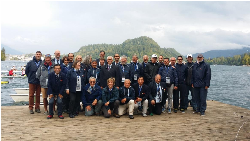
今回の審判（ITO と NTO それぞれ半数）と役員です。