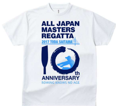
ホワイト半袖・長袖