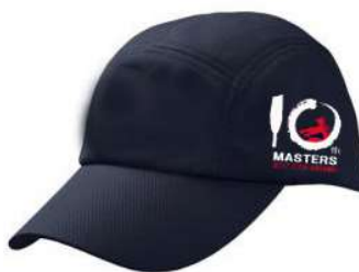
<ネイビーキャップ>

下記の表はシャツの仕上り実寸です。今年のシャツは日本サイズです。 備考欄はあくまで目安です。お手持ちのシャツ等参考の上お選びください