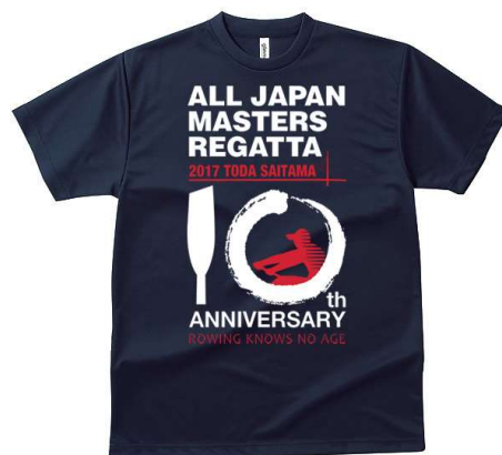
ネイビー 半袖・長袖