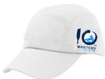
<ホワイトキャップ>