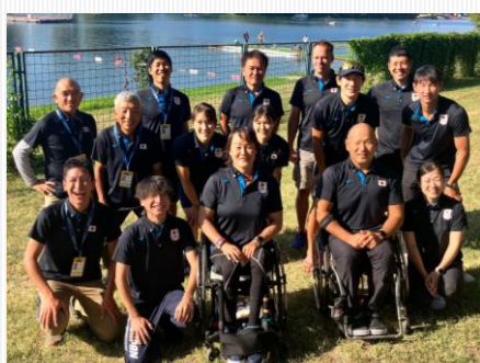
世界選手権日本選手団 (オリ・パラ) 応援いただき、誠にありがとうございました。

公式X (旧Twitter) もご覧ください！！ @JAPANParaRowing https://twitter.com/JAPANParaRowing