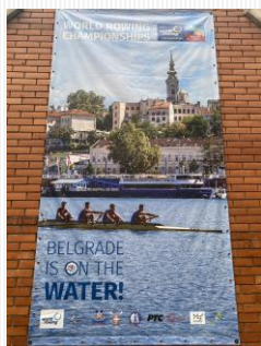
市街地に掲示された 大会の幟