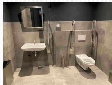
バリアフリー対応洗面所