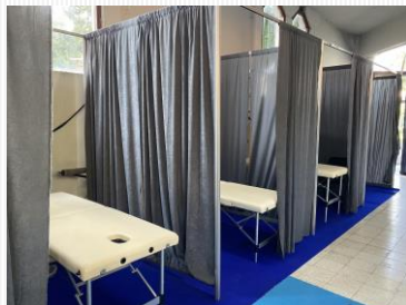
トレーナーの仕事場 会場のマッサージルーム