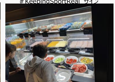
ホテルの食事(朝食ビュッフェ)