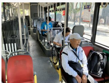
宿舎～会場のバスは車いす選手が 乗りやすい市バスタイプ