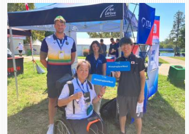
WorldRowingIntegrityブースで ITA(InternationalTestingAgency)の #KeepingSportReal サイン