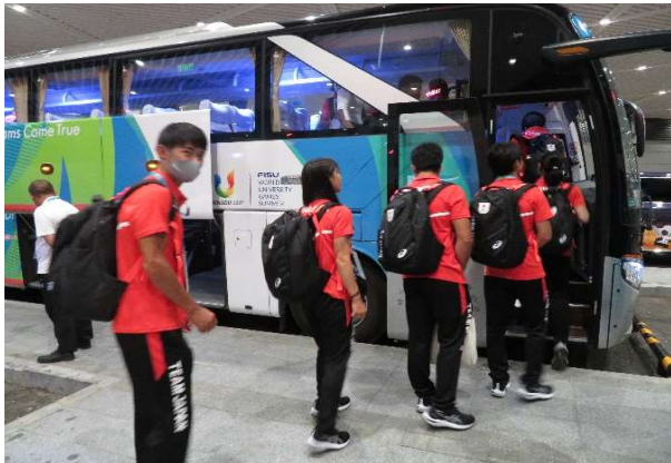
選手村に向かうバスに乗り込むWUG日本代表チーム。