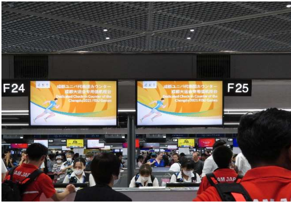
成田空港で、WUG日本代表チーム専用カウンターチェックインする選手団。