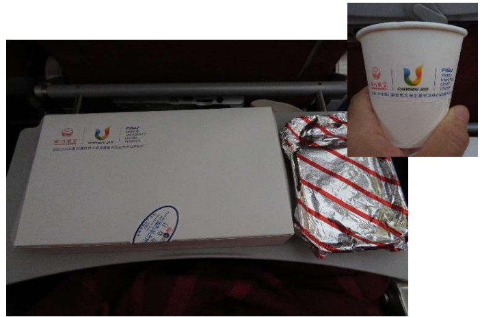
機内食は提供される飲料の紙コップにも今大会のマークが入っており、開催国の力の入れ方がうかがえます。