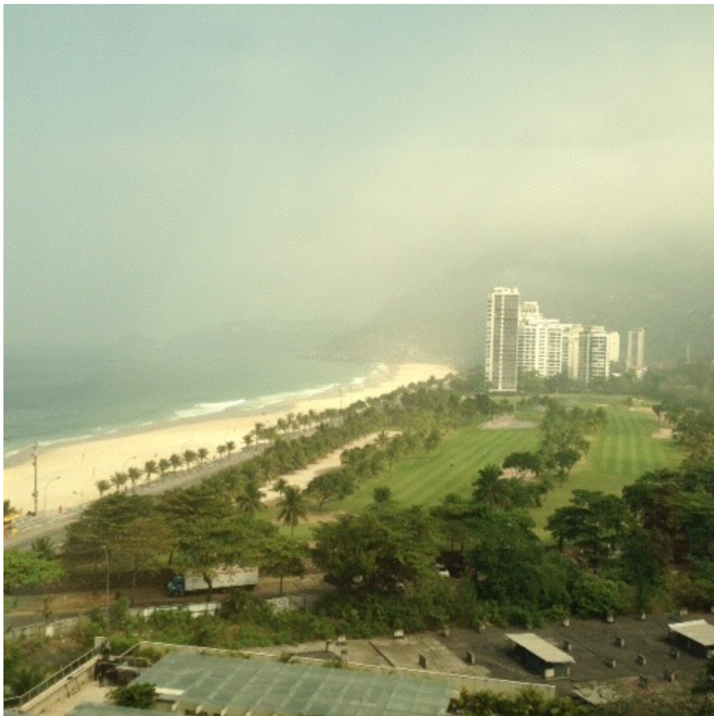
ホテル12階からの眺望。