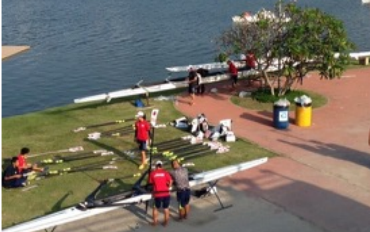
中下：リギングを始めました。