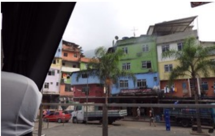
下：これまでの写真と全く雰囲気の違いがします。実際に危険だそうです。