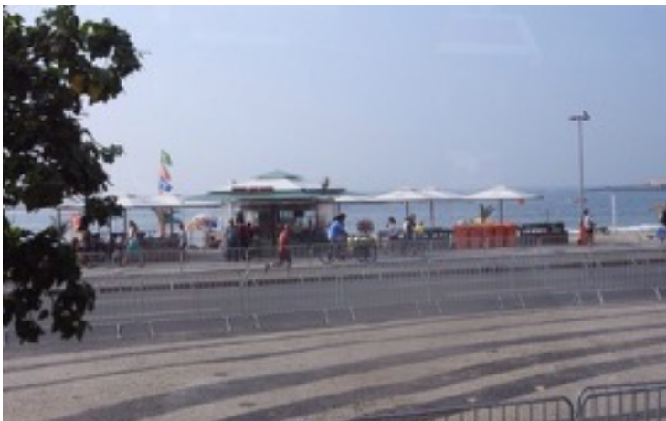
中上：リオの観光地・コパカーナの海岸